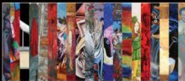
"L'Arte racconta l'anima"

Venti gli artisti espositori non solo italiani ma anche provenienti dal Senegal, dal Burundi e dalla Corea. La mostra, che rimarrà visitabile fino al 31 ottobre 2011 (dal lunedì al venerdì dalle ore 9,00 alle ore 18,00 - il sabato e la domenica dalle 9,00 alle 13,00) è stata organizzata dall'Istituzione Museo Civico di Maddaloni e dal Centro Culturale Arianna Napoli est.